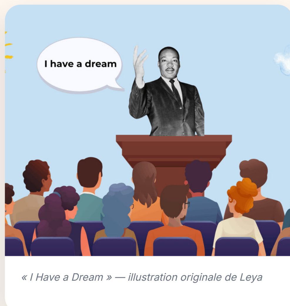
« I Have a Dream » — illustration originale de Leya

"Il était très courageux. Il s'est battu avec sa tête et pas avec ses muscles. Je le félicite."