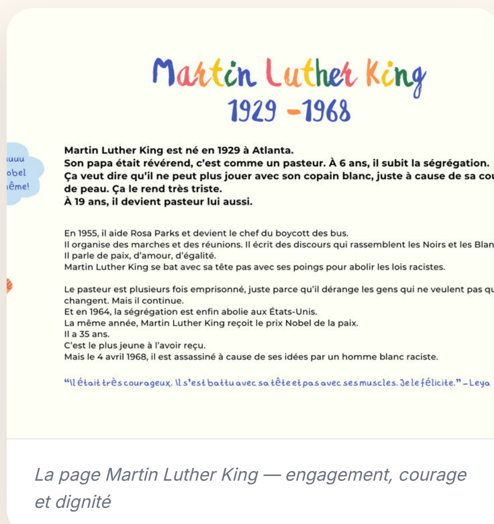
La page Martin Luther King — engagement, courage et dignité