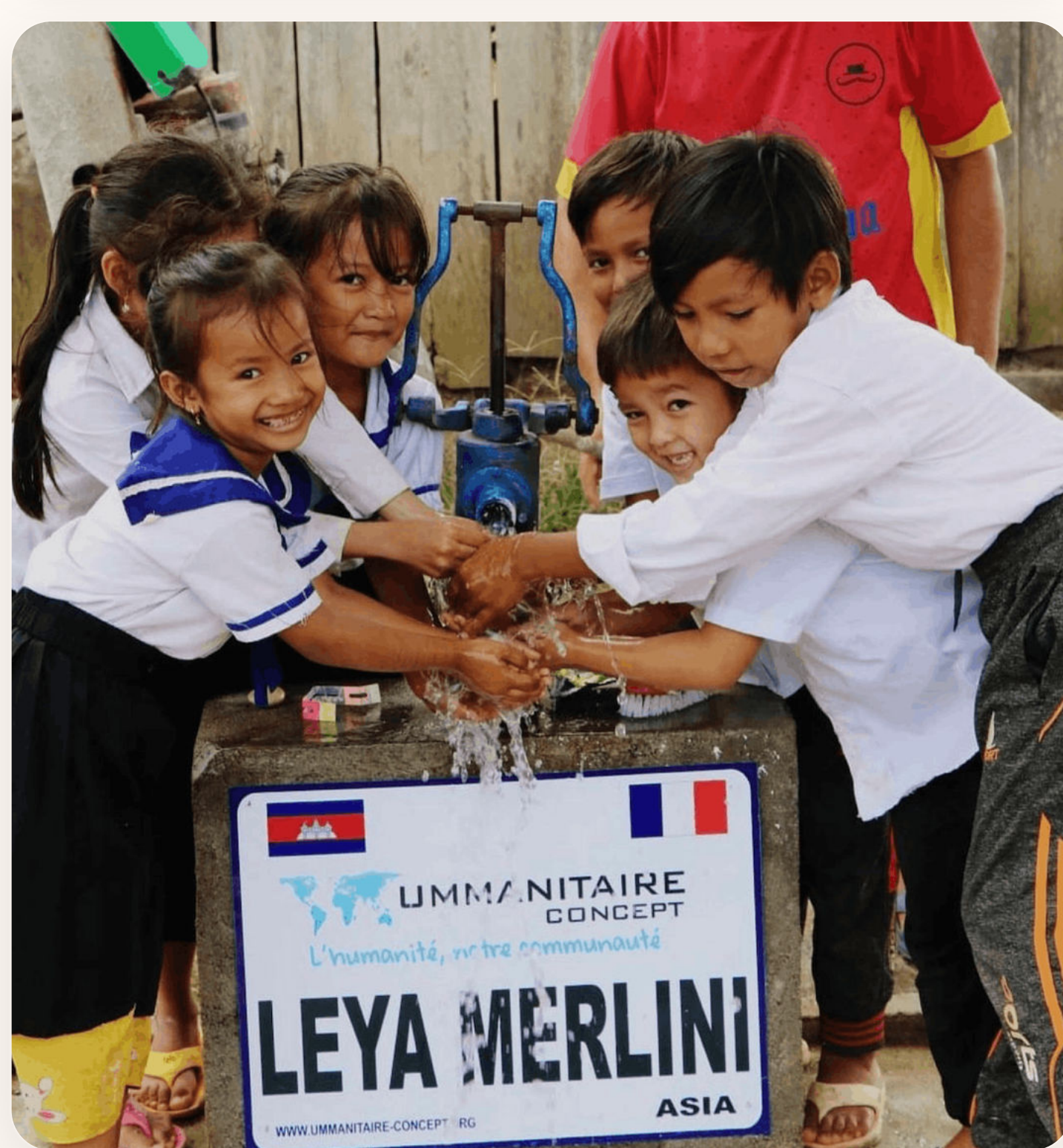
Le puits construit au Cambodge grâce à Leya — Ummanitaire Concept

Déjà, Leya poursuit son chemin avec une nouvelle initiative consacrée à la question des sans-abri, en contact avec l'artiste de renommée internationale JR, pour explorer comment combiner l'art et l'impact concret.