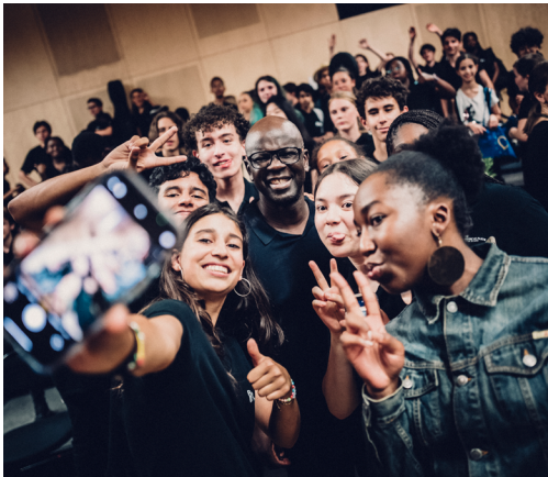
Séance photos pour les enfants de l'Orchestre avec Lilian Thuram.

Champion du monde de football en 1998 et président de la fondation «Éducation contre le racisme», Lilian Thuram est pour Démos un parrain enthousiaste et impliqué. Né en Guadeloupe et arrivé en France métropolitaine à l'âge de 9 ans, Lilian Thuram a grandi dans une cité de la banlieue parisienne. Il découvre la musique classique grâce à son institutrice de CM2, qui fait écouter chaque vendredi à ses élèves un répertoire varié. Bouleversé par ce qu'il entend, il n'osera cependant pas assumer ce que lui inspire cette musique.