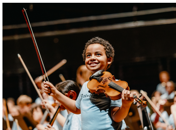
Sur la scène de la grande salle

—À l'issue des trois ans, l'enfant peut bénéficier d'un accompagnement vers le conservatoire ou l'école de musique de son territoire. Il conserve alors son instrument de musique. Il peut aussi parfois intégrer un orchestre Démos de niveau avancé.