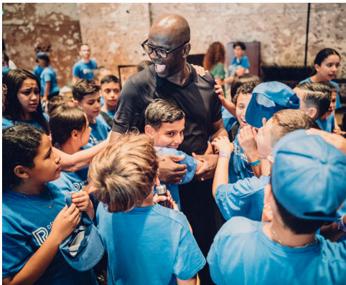
Séance photos pour les enfants de l'Orchestre avec Lilian Thuram.

« Les gamins des banlieues sont conditionnés dès leur plus jeune âge. Pour eux, la musique classique est un corps étranger, un truc inaccessible, qui ne leur est pas destiné. Et à l'époque, des programmes comme Démos n'existaient pas. C'est presque une revanche pour moi de m'impliquer aujourd'hui pour le développement de Démos. C'est un projet extraordinaire qui offre la possibilité aux enfants de s'enrichir culturellement par la musique classique, sans aucune barrière sociale ou économique. Cette démarche ouvre leur horizon. »