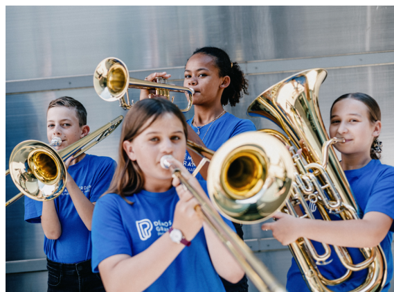
Portraits cuivre © Pierre Morel