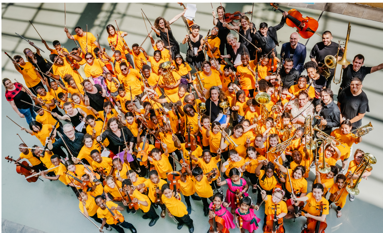
Portrait de groupe.

Initié en 2010 et coordonné par la Philharmonie de Paris, Démos (Dispositif d'éducation musicale et orchestrale à vocation sociale) œuvre en faveur de la démocratisation culturelle par la pratique musicale en orchestre. Il forme les futurs citoyens du XXI e siècle en plaçant la musique au cœur de leur développement, et en donnant une place centrale au travail social.