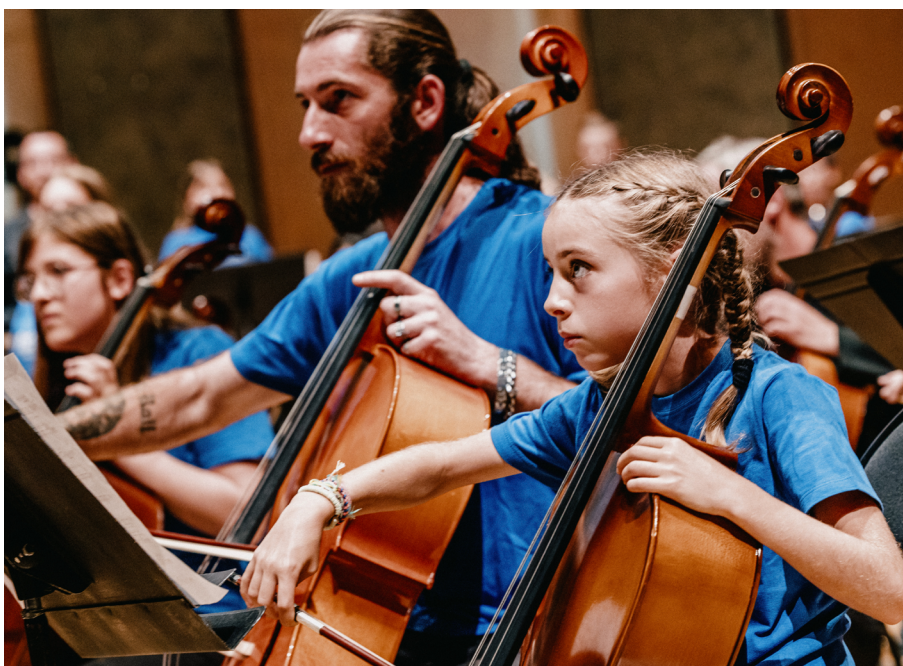
Le concert sur la scène de la Cité de la Musique.