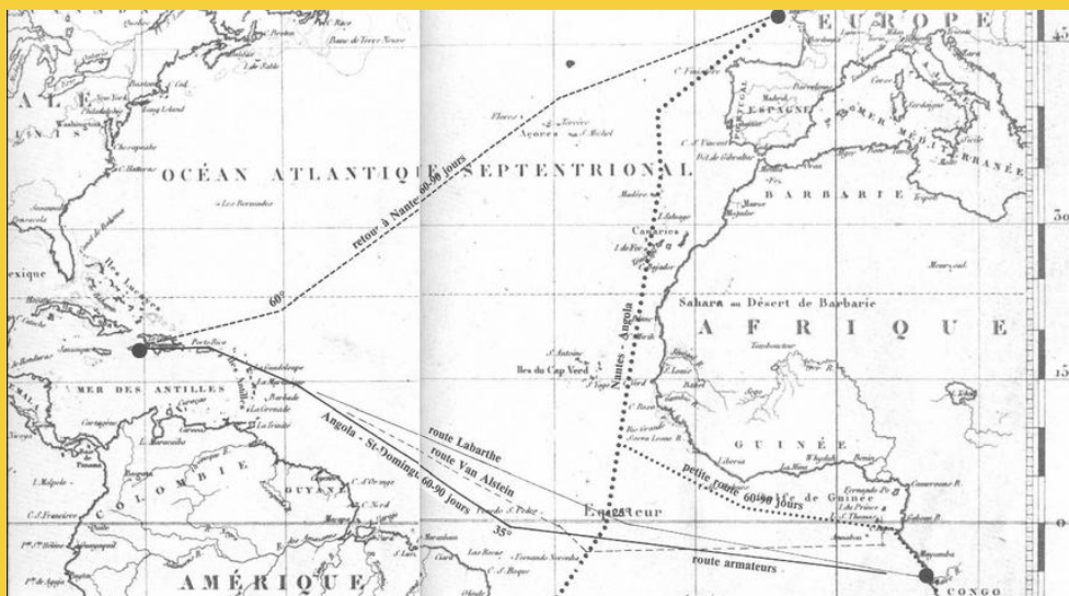
Carte du commerce triangulaire

Artiste burkinabé, il fait ses débuts dans la sculpture en 1995 au Centre National d'Artisanat d'Art à Ouagadougou. Il travaille le bois, le bronze et le fer. Il expose dans différentes galeries au Burkina Faso et en France. Il est installé en France depuis 2010. Il construit la maquette d'un bateau négrier pour le spectacle C'est quoi l'esclavage ? ainsi qu'une mappemonde gigantesque de 3m x 2m. Site : http://www.sylvain-yerbanga.com/ .