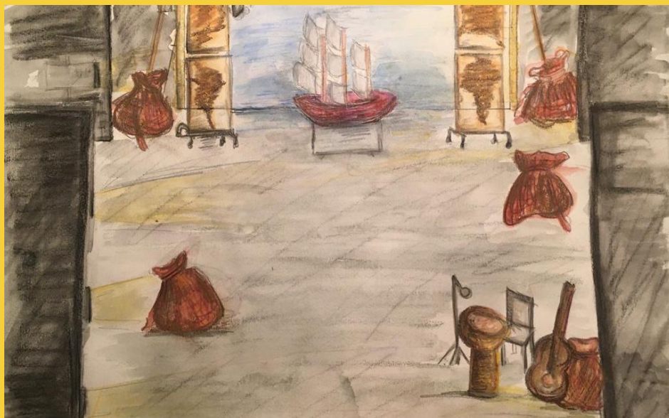
Dessin de la scénographie de C'est quoi l'esclavage ? - Kocella Aouabed (création lumière)