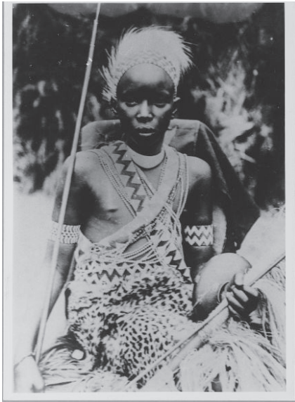
Mwambutsa IV Bangiricenge