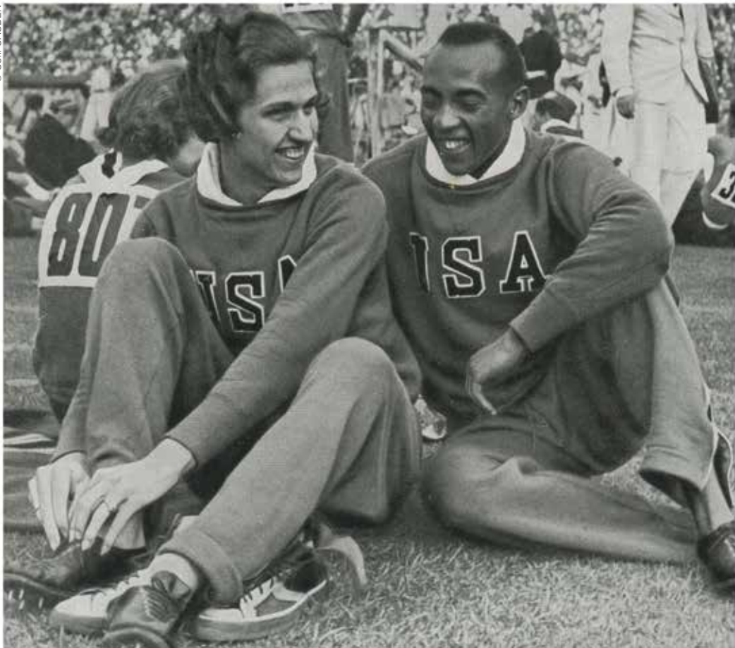
Helen Stephens et Jesse Owens, Berlin, 1936.